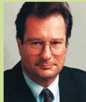
Dr. Klaus Kinkel ehemaliger Bundesminister