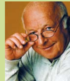
Dr. Norbert Blüm ehemaliger Bundesminister