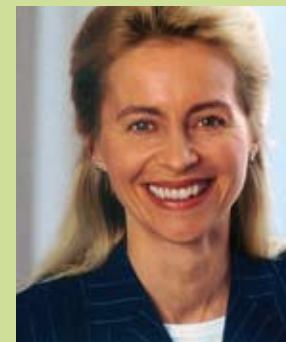
Dr. Ursula von der Leyen Bundesministerin für Familie, Senioren, Frauen und Jugend