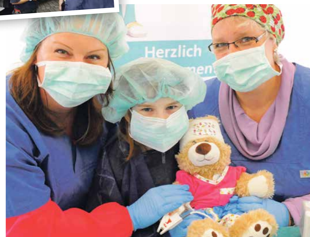
Verletzte Kuscheltiere und Puppen finden zur Freude ihrer kleinen Besitzer Hilfe im Teddy-Krankenhaus auf der City-Gesundheitsmesse.

Einige der vielen Angebote auf der City-Gesundheitsmesse: kostenloser Blutzuckertest, begehbares Herzmodell und jede Menge Info-Stände