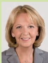
Ханнелоре Крафт Премьер-министр земли Северный Рейн-Вестфалия