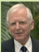
Проф. Харальд Цур Хаузен Германский онкологический центр, Хайдельберг Лауреат Нобелевской премии