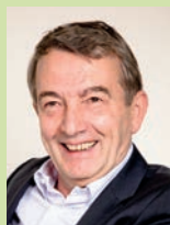
Д-р Вольфганг Нирсбах Президент Немецкого футбольного союза