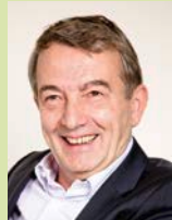
Dr. Wolfgang Niersbach Deutscher Fußball-Bund e. V. Başkanı