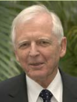
Prof. Harald zur Hausen Alman Kanser Araştırması Merkezi Heidelberg Nobel ödüllü