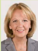
Hannelore Kraft Kuzey Ren-Vestfalya Eyalet Başbakanı