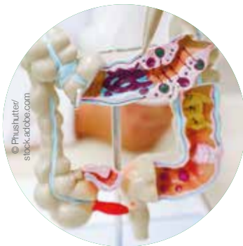
Modell eines Dickdarms

In Zukunft wird mit Hilfe der Künstlichen Intelligenz (KI) eine deutlich verbesserte Polypen-Erkennung möglich sein.